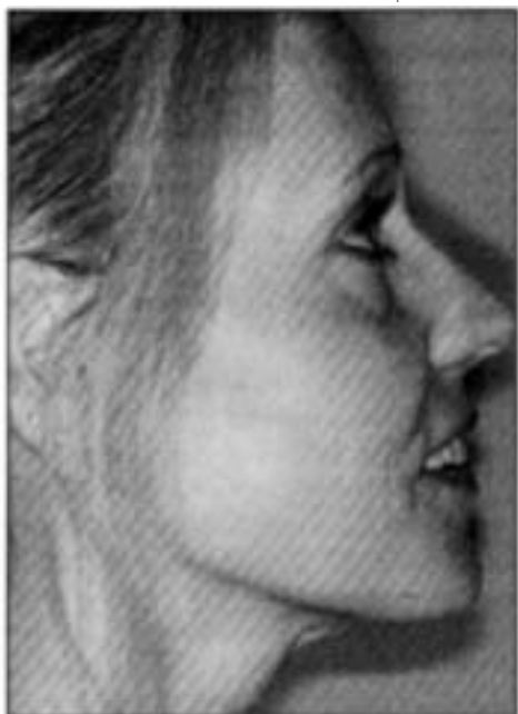
Verjüngungseffekt ohne Skalpell und Wunden: Radiofrequenzenergie dringt tief in die Haut ein, glättet und strafft behandelte Gesichtsräume. Links: vorher; rechts: zwei Monate nach der Behandlung.