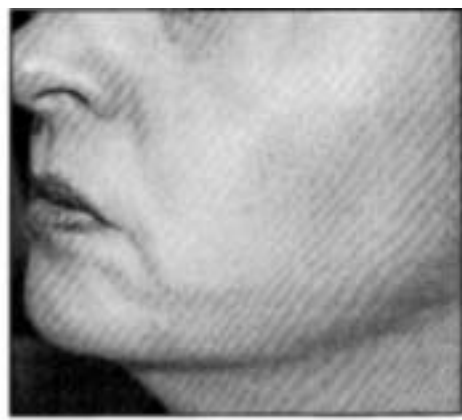
Bei dieser Patientin haben Ärzte die Nasolabialfalten und andere sichtbare „Zeichen der Zeit“ an Kinn und Wangen mit dem ThermoCool-System behandelt. Das linke Foto zeigt die Patientin vor der Behandlung, das rechte Foto entstand zwei Monate nach der Behandlung.

„Soforteffekt“ 11 ; die Mehrheit zeigt sichtbare und spürbare Hautverbesserungen aber erst nach zwei bis acht Wochen. Der vollständige Remodellierungseffekt der Haut ist dann nach ungefähr sechs Monaten abgeschlossen. In dieser Zeit gewinnt der Straffungs- und Verjüngungseffekt täglich weiter an Konturen.